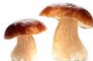
Белый гриб (боровик)